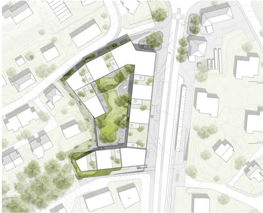
Abb. 2 Situation: Blockrandähnliche Grossform mit Innenhof.

Das Team hat sich von Anfang an für den Ersatz der bestehenden Gebäude des Bärenareals mit einer blockrandähnlichen Grossform entschieden. Die an der Zwischenbesprechung genannte Kritik wurde aufgenommen und der Ansatz entsprechend weiterentwickelt. Die Grossform versucht an diesem zentralen Ort eine eigene, neue Identität zu etablieren und eine grosse Dichte zu schaffen.