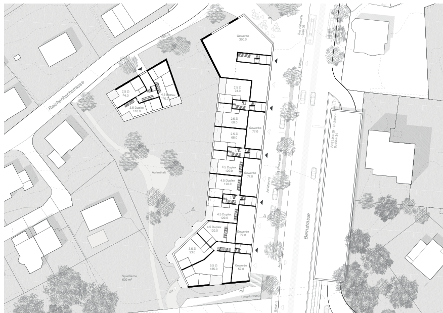
Abb. 10 Erdgeschoss

Die Massierung des Volumens in einem grossen Hauptbaukörper ist mutig und ein visionärer Versuch, eine zentrumsgerichte, hohe bauliche Dichte mit grosszügigen Freiflächen zu schaffen. Insgesamt wird das Volumen in seiner absoluten Grösse und Mächtigkeit für Unterzollikofen jedoch als zu wenig ortsverträglich beurteilt. Das Konzept schafft attraktiven Wohnraum an zentraler Lage und besticht durch eine intelligente Aufteilung des Erdgeschosses. Die städtebaulichen Aussagen der einzelnen Baukörper und des Kopfplatzes bleiben insgesamt jedoch unklar. Durch die gewisse Absolutheit des Konzeptes bleibt aus Sicht des Beurteilungsgremiums wenig Spielraum, das Konzept weiterzuentwickeln, ohne es gänzlich aufzubrechen.