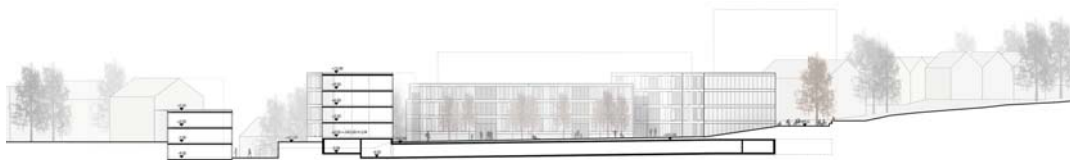
Abb. 7 Ansicht Ost