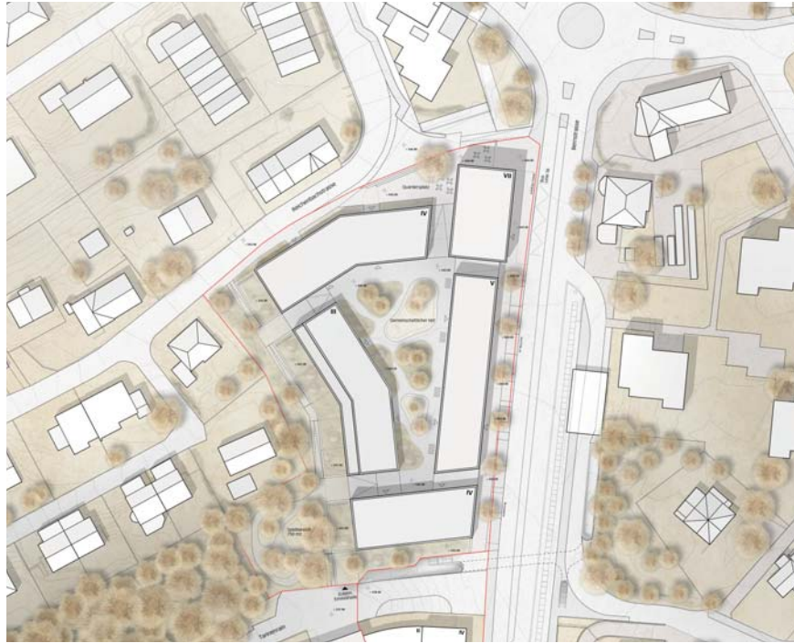
Abb. 5 Situation: Aufgeschnittener Blockrand mit fünf einzelnen Baukörpern.

Das Team hat sich sehr eingehend mit den Eigenheiten des Orts auseinandergesetzt und den Erhalt der bestehenden Bauten bis zur Zwischenbesprechung geprüft. Die an der Zwischenbesprechung genannte Kritik wurde aufgenommen und die Öffnung der Rahmenbedingungen – ein möglicher Abbruch der erhaltenswerten Gebäuden – genutzt, um das Konzept zu überdenken und weiterzuentwickeln. Das Konzept besteht durch einen sehr subtilen Umgang mit und eine sanfte Eingliederung in die landschaftliche und ortsbauliche Situation.