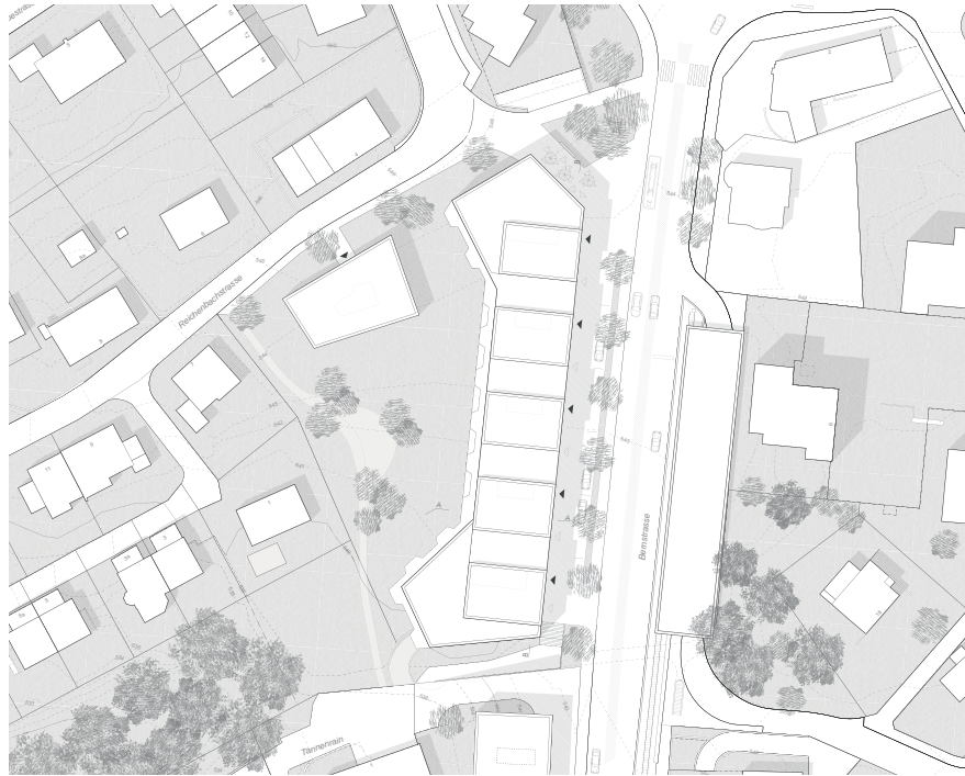
Abb. 9 Situation: Längskörper mit ergänzendem Pavillon.

Das Team hat sich intensiv mit dem Entwicklungsziel des Ortes auseinandergesetzt und bis zur Zwischenbesprechung zwei Varianten mit unterschiedlichen Visionen – die Stärkung des Bärens (Bären+) und die Stärkung von Unterzollikofen als Zentrum (Unterzollikofen+) – ausgearbeitet. Die an der Zwischenbesprechung genannte Kritik wurde aufgenommen und das Konzept auf Grundlage der Variante Unterzollikofen+ weiterentwickelt. Das Konzept zeichnet sich durch eine einfache Gebäudestruktur aus, die das Volumen konzentriert und dadurch grosszügige Freiräume schafft.