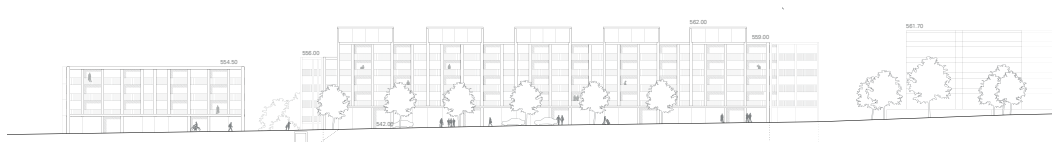
Abb. 12 Ansicht Ost