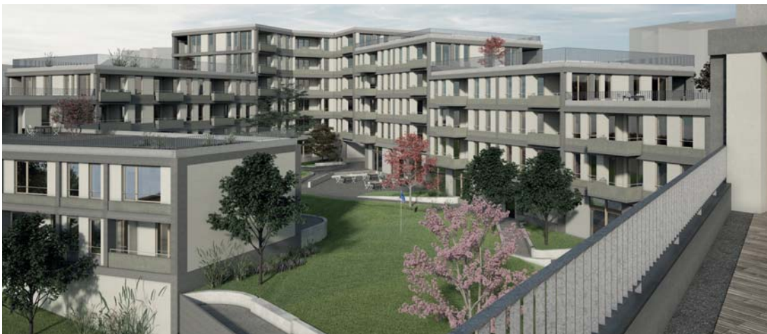
Abb. 3 Ansicht Westfassade, Blick auf Innenhof.

Die Grossform setzt mit einem Baukörper eine klare Geste im Baugesüge von Unterzollikofen und verschafft dem Bärenareal dadurch eine eigene Identität. Die Staffelung der Gebäudehöhen verleiht der grossen Masse die nötige Gliederung. Die Form des Baukörpers ist ein inspirierender Ansatz und ermöglicht interessante und attraktive Wohnungsgrundrisse. Trotz der geschickten Höhenstaffelung des Volumens stellen sich an diesem zentralen, im öffentlichen Fokus stehenden Ort Fragen zur ortsbaulichen Integration und zur politischen Akzeptanz. Die grossmasstäbliche Form greift in das Quartier ein und reagiert in ihrer Ausformulierung zu wenig auf die unterschiedlichen Nachbarschaften. Auch weist sie eine gewisse Starrheit auf, die eine Weiterentwicklung des Konzepts erschwert und bezüglich Etappierung, Gestaltung, Möglichkeit von nachträglichen Korrekturen, etc. einschränkend ist.