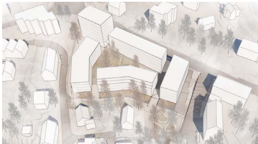
Abb. 6 Vogelperspektive aus Westen

Quartierplatzes oder der Kantenbildung entlang der Bernstrasse), so dass das Konzept städtebaulich überzeugt. Das Konzept schafft es, mit Einzelgebäuden ein stimmiges Ensemble zu bilden und dem Bärenareal Charakter zu verleihen. Es besteht durch seinen robusten städtebaulichen Ansatz, durch seine für Unterzollikofen angemessene Massstäblichkeit, sowie durch ein sorgfältig ausgelotetes Verhältnis zwischen Freiraum und Dichte, das im südlichen Hofteil noch optimiert werden muss.