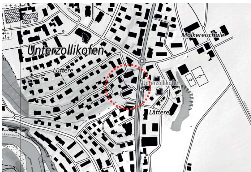
Abb. 1 Lage des «Bärenareals» in Zollikofen

Gemäss dem Richtplan Siedlung bietet sich das Bären-areal aufgrund seiner optimalen ÖV-Erschliessung und seiner Lage an der Bernstrasse für eine Verdichtung und Umstrukturierung an. Das Massnahmenblatt sieht mittelfristig eine Anpassung der ZPP vor und verlangt für den Perimeter die «Organisation und Durchführung eines qualifizierten Verfahrens mit mehreren Teams».