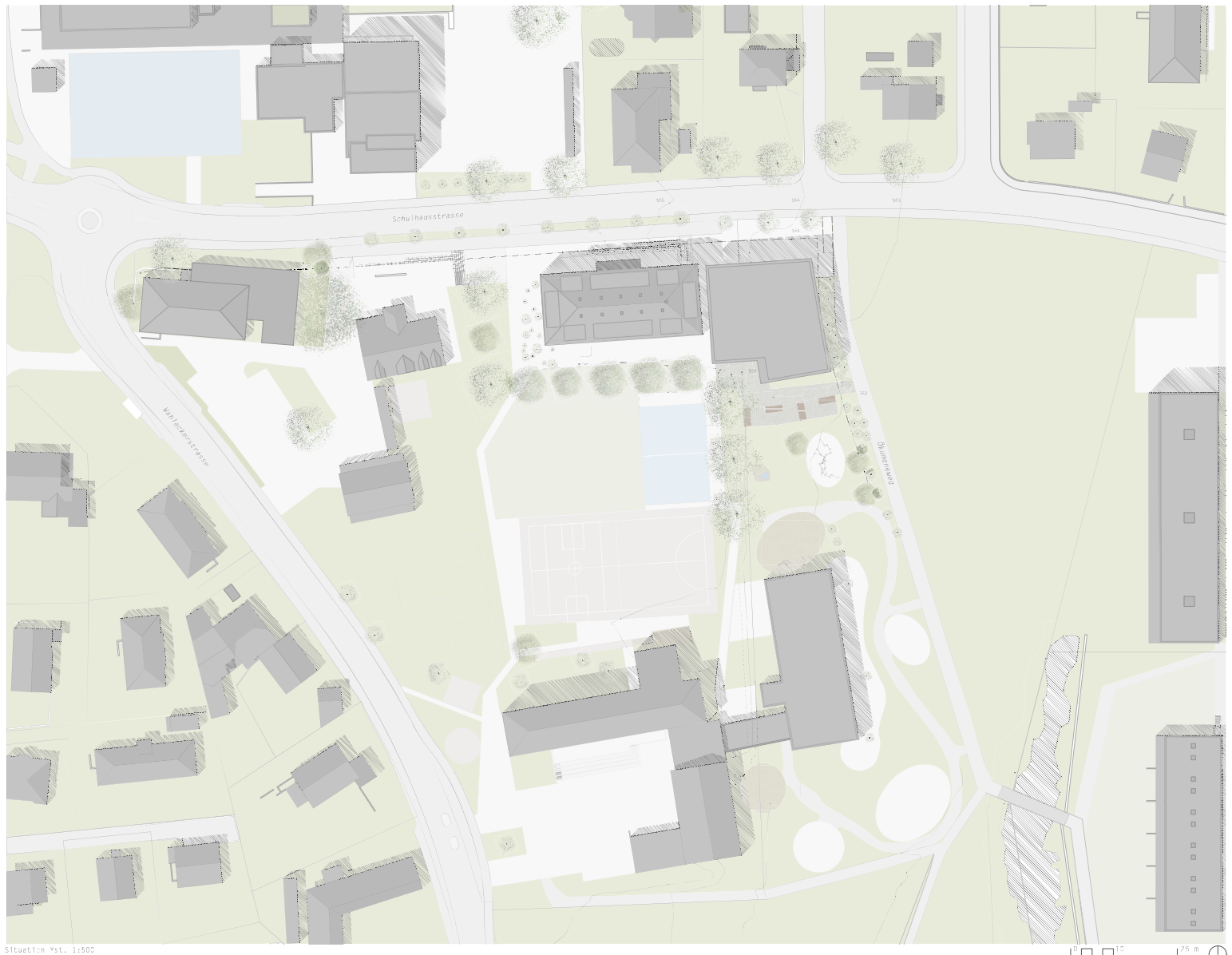
Situation Mst. 1:500

Die Gestaltung der Umgebung ergänzt die Aussenräume des benachbarten Kindergartens Hüberlmatte. Zusätzliche Sitzelemente laden ein zu Verweilen. Zwischen Steifen befinden sich Sand- und Wasserspiele. Holzene Elemente zum Balancieren und Schaukeln bieten viele Möglichkeiten zum Spielen und Ausüben. Die Wiese ermöglicht diverse Spiele mit oder ohne Ball. Entlang des Ökumenenweges begrenzen Sträucher und Stauden den Aussenraum und stützen so einen beschaulichen Rahmen für die Kinder. Die bestehenden aber auch neuen Bäume spenden im Sommer den notwendigen Schatten und die Kühle.