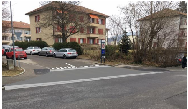
Abb. 3 Zelgweg mit Trottoirüberfahrt