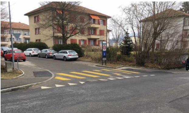
Abb. 2 Zelgweg bisher

An verkehrsorientierten Strassen mit signalisierten Geschwindigkeiten > 30 km/h eignen sich Trottoirüberfahrten, um die Sicherheit für zu Fuss Gehende im Bereich von einmündenden Strassen zu erhöhen. Auf Trottoirüberfahrten sind die zu Fuss Gehenden vortrittsberechtigt. An der Wahlackerstrasse wurden entsprechende Anpassungen bei den Einmündungen von Lüfternweg und Schmittstützli bereits realisiert. Ausstehend sind Trottoirüberfahrten bei der Einmündung Zelgweg (heute Fussgängerstreifen) und dem Zugang zum Friedhof (heute Vortritt zu Gunsten der Strassenbenutzenden). Bei den Einmündungen Hessweg, Lindenweg und der Zufahrt zur Einstellhalle Häberlimatte sind Trottoirüberfahrten angedeutet. Die Gestaltung entspricht aber weder den Normen noch den anderen bereits erstellten Trottoirüberfahrten in der Gemeinde Zollikofen. Die Trottoirüberfahrten sind ein gutes Mittel, um die Schulwegsicherheit zusätzlich zu verbessern.